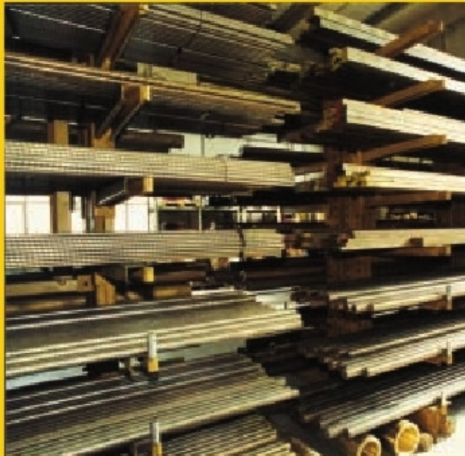
TABELLA BARRE PIATTE IN BRONZO 85.5.5.5 (UNI 7013) lunghezza commerciale 3000 mm